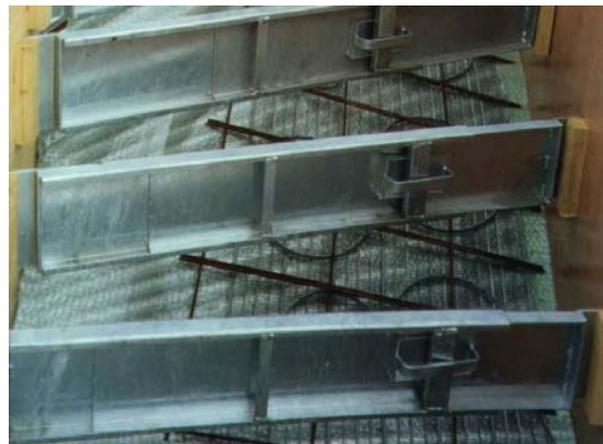
5. Armierung und Stufenabschalung montieren