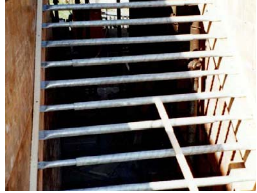
2. Teleskoprohre montieren