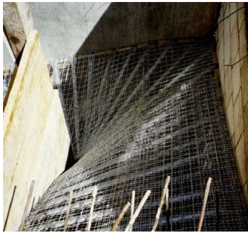
3. Wellgitter mittels Bindedraht (18 cm) befestigen