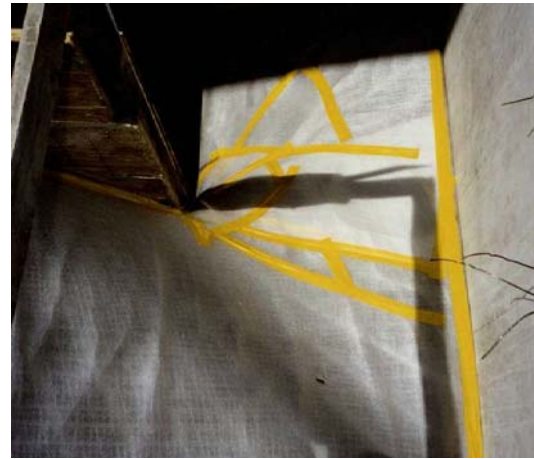
4. spezielle Folie mittels Gipsplatten befestigen