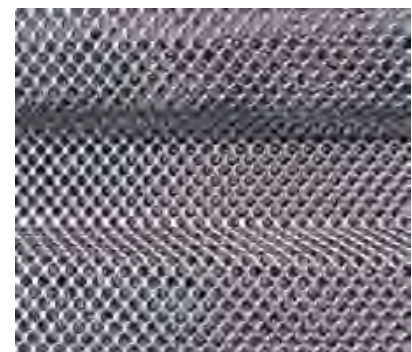
Streckmetall profiliert Fugenkategorie "verzahnt"