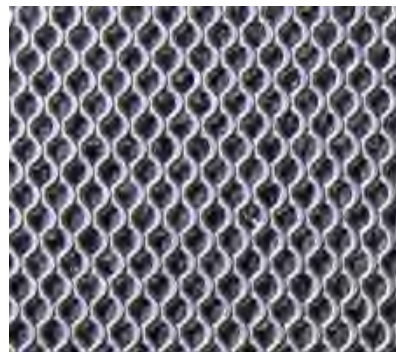
Streckmetall glatt Fugenkategorie "rauh"