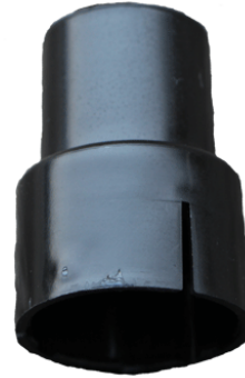
Reduzierstück zu Wassersperre