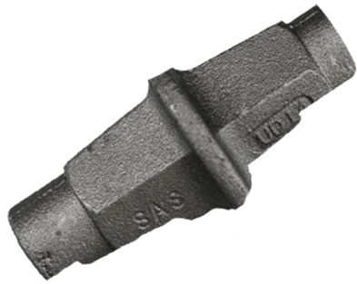
Wassersperre mit kleiner Scheibe